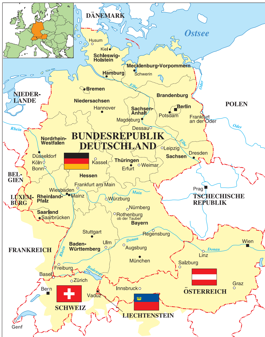
ドイツ語圏略地図 (黄色はドイツ語使用地域)